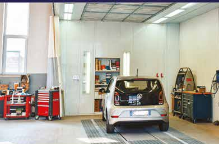
VOLKSWAGEN VEICOLI COMMERCIALI