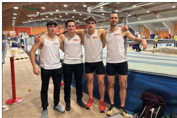
I quattro staffettisti della 4x200m