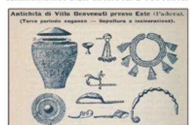
Antichità di Villa Benvenuti presso Este (Padova). (Terzo periodo euganeo - Sepoltura a incinerazione).